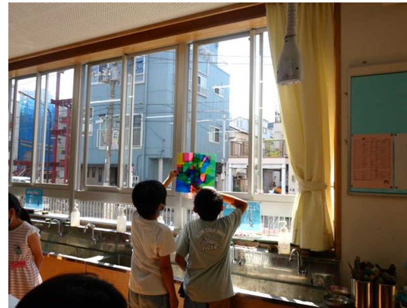
3年生 「ひかりの絵画」(6月実施) カラーセロハンを使った活動でした。窓の光に向かって、友だちと一緒に鑑賞しました。