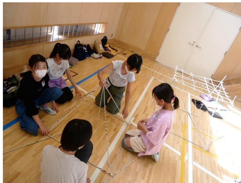
5年生 「つなぐんぐん」(4月実施) 5年生になって初めての図工は体育館で行いました。友だちと協力して、新聞紙の棒をどんどんつなげて、活動しました。