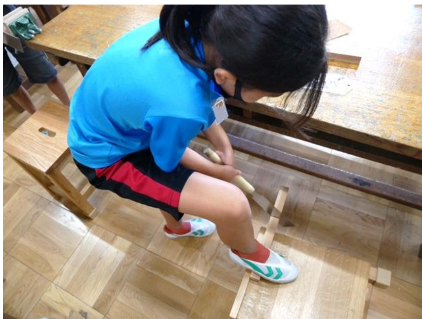
4年生 「トントンつないで」(9月実施) 木材をのこぎりで切って、釘で打ってつなげました。のこぎりの扱いも手慣れたものです。