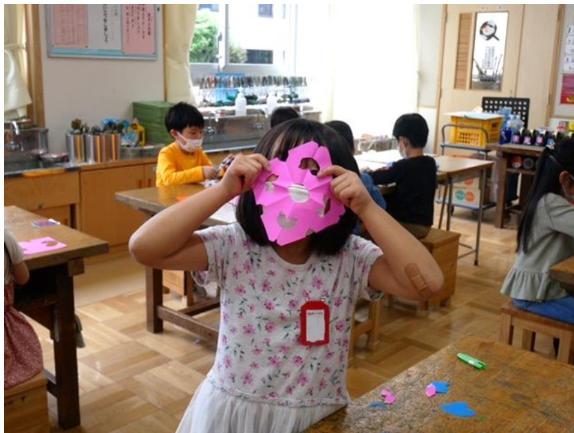
1年生 「ちよっくんぱっ！」(4月実施) 記念すべき初めての図工室での活動でした。 折り紙を、折って切って開いてみると・・・!?