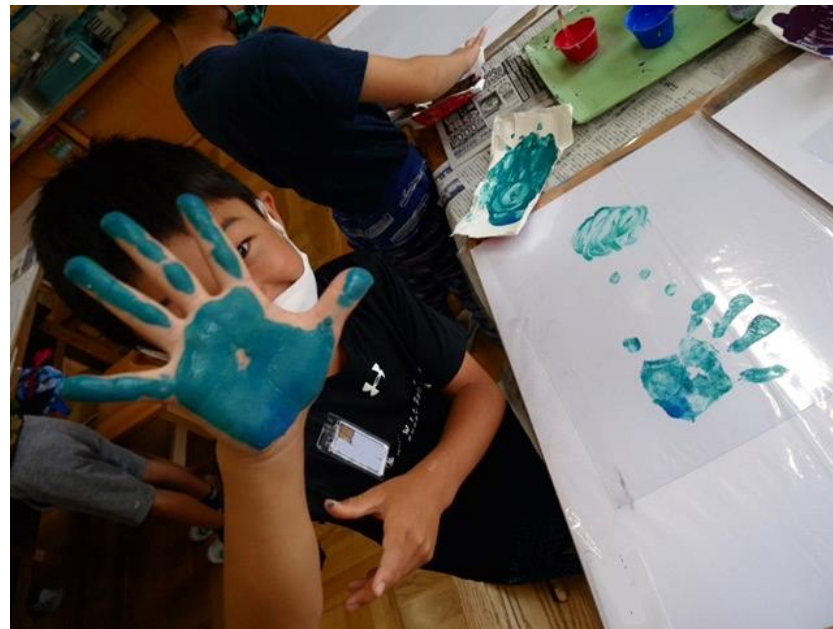
2年生 「つるつるすべすべ大発見！」(6月実施) 写真紙やラミネートシートなどつるつるとしたものに、手で絵を描きました。先生、僕の手見て下さい!